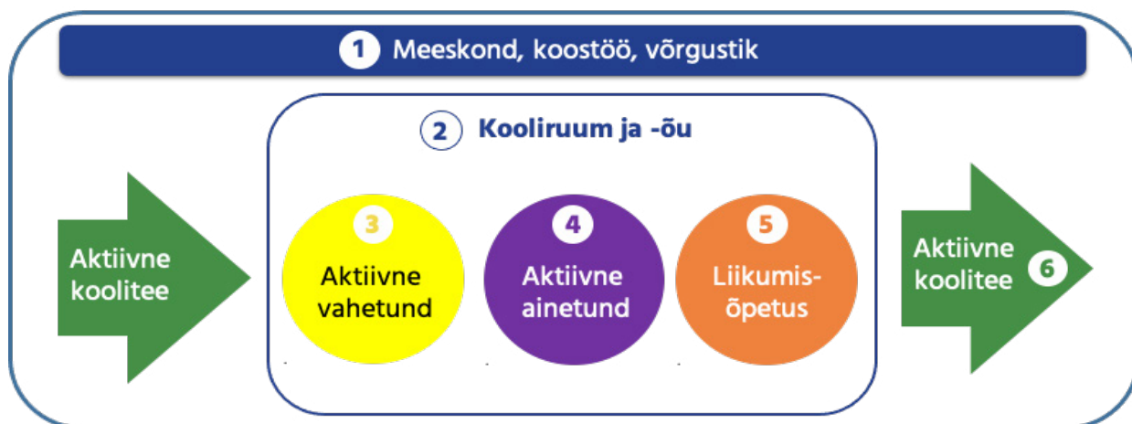
Joonis 1. Liikuma Kutsuva Kooli (LKK) võrgustiku mudel

Liikuma Kutsuva Kooli eneseanalüüsi ehk KENA valdkonnad: